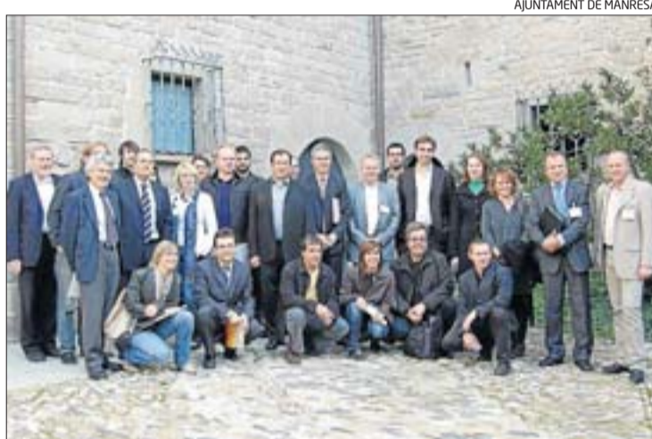
Fotografia de grup dels participants a la trobada de REDIS

Durant tres dies, una delegació de les diverses ciutats ha conegut sobre el terreny la capital del Bages i els seus agents econòmics i universitaris per fer-se una idea de les possibilitats de futur de la ciutat. Una part de les conclusions de l'anàlisi d'aquests experts es va fer pública ahir. Al cantó de la balança dels elogis, els visitants europeus destaquen la voluntat de la ciutat de tirar endavant un projecte com el del Parc Central en un moment de crisi, l'actitud empreedora dels agents locals i la seva situació geogràfica, prou a prop de