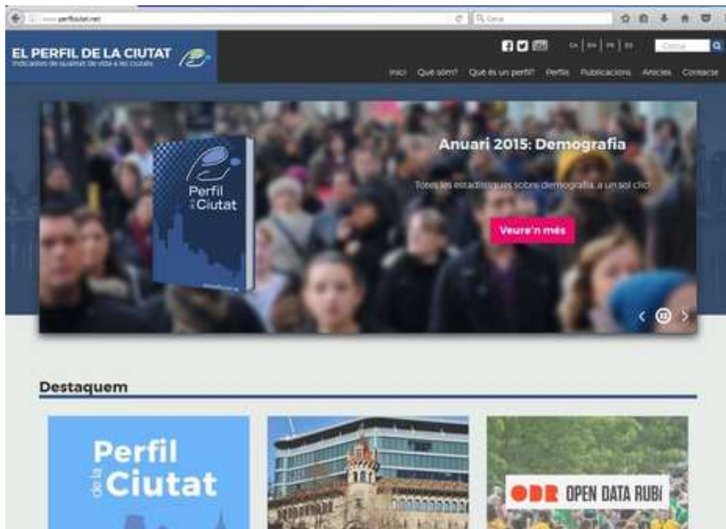
New image for the web site 2017