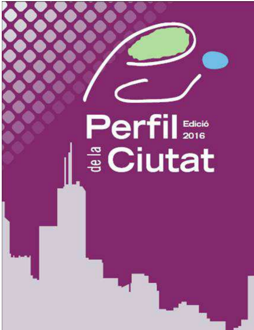
Cover of 2016 Report