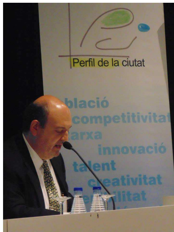
Conference in Sabadell Oct 2014 – Talking about Big Data management and Cities Information