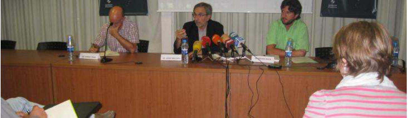
Conference in Granollers Sep 2011 – Statistic reports and journalism of investigation