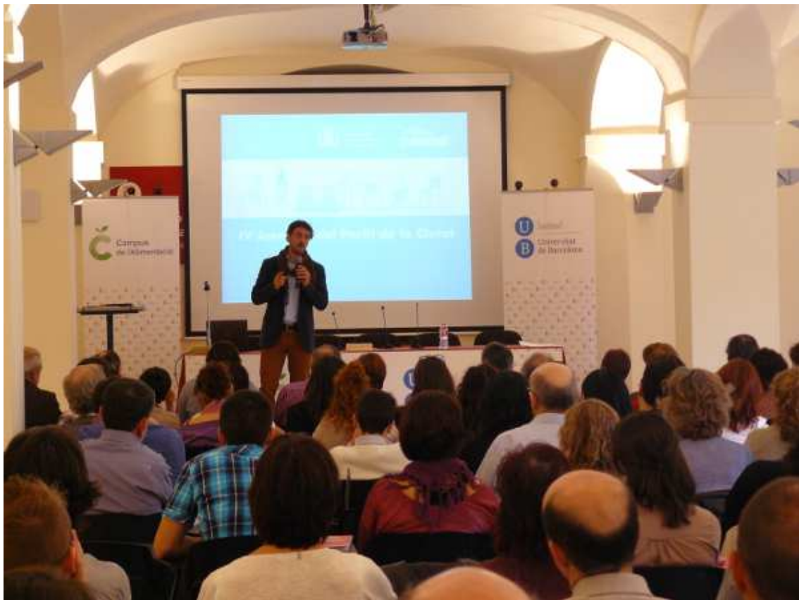
Conference in Santa Coloma de Gramenet Nov 2013 – Introducing the report at the Research Centre for Food Industries