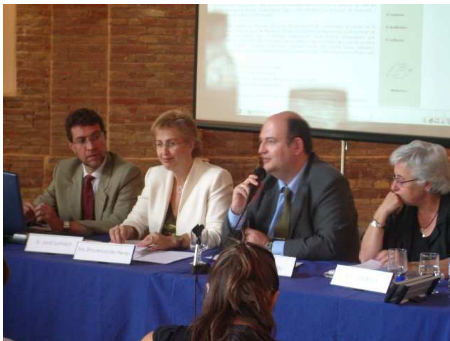
Conference in Vic 2006 – Talking about horizontal networks between cities and about the set of indicators of municipal monitoring: indicators of QoL and social cohesion (Report AQR-UB)