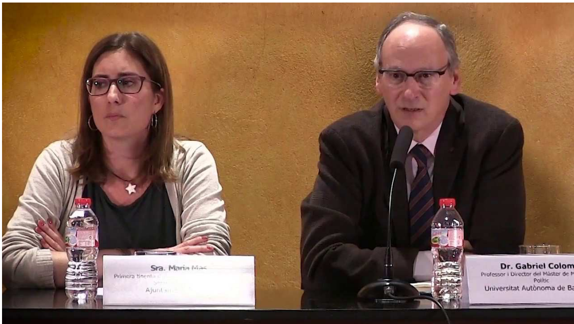
Conference in Rubí Nov 2016 – Public info, published info, perception and governance