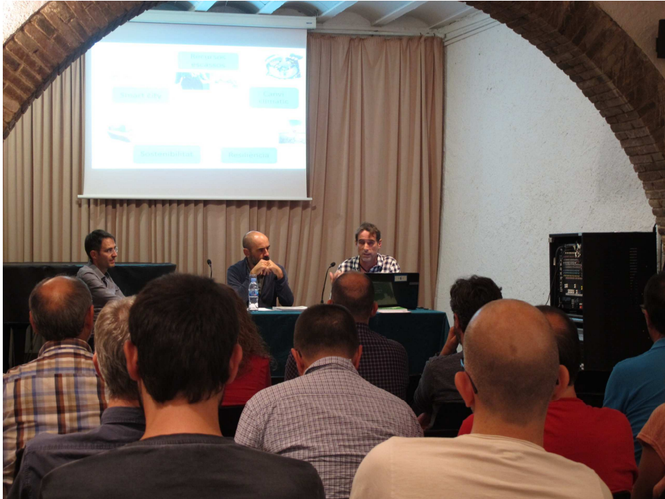
Conference in Mollet del Vallès Oct 2015 – Focusing sustainable development of cities